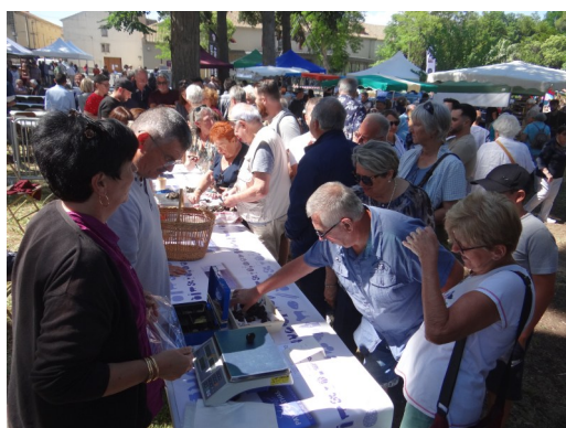
Marché de la truffe