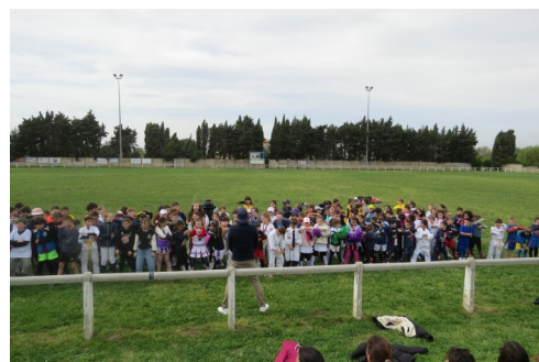
Carnaval des écoles