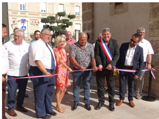
Inauguration cœur de ville