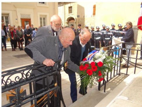
Cérémonie 8 mai