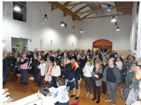
Vœux du maire