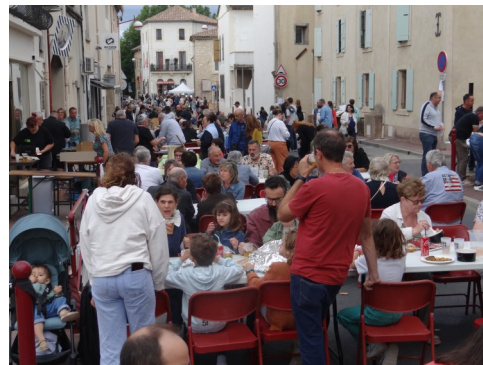
Rues en fête