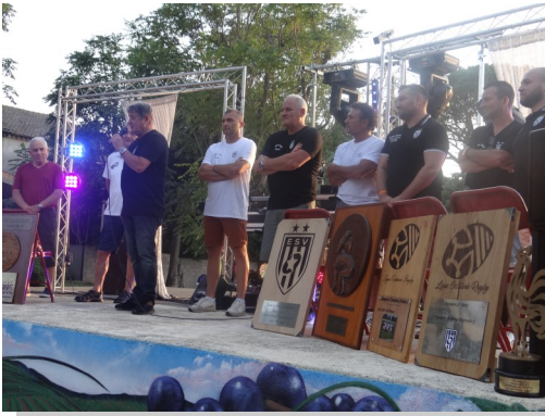
50 ans ESV