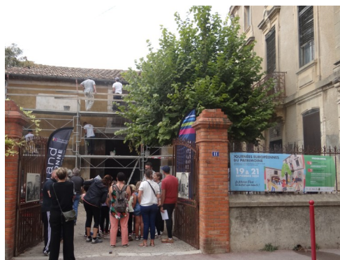
Journées du patrimoine: Maison PECH