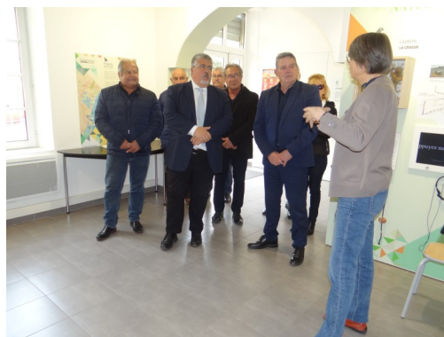
Visite du préfet