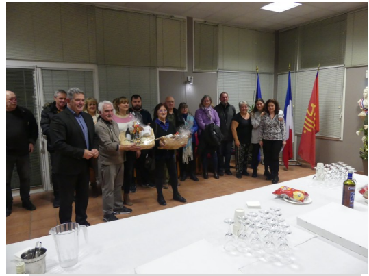
Remise des prix illuminations de Noël