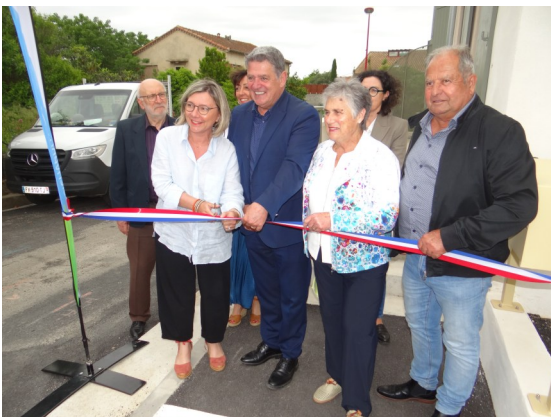
Inauguration logement Habitat Audois