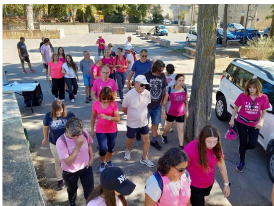
Marche octobre rose