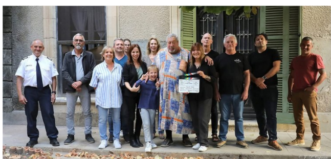
Tournage maison PECH