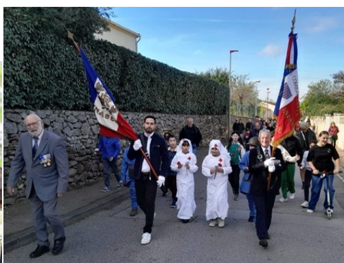
Cérémonie 11 novembre