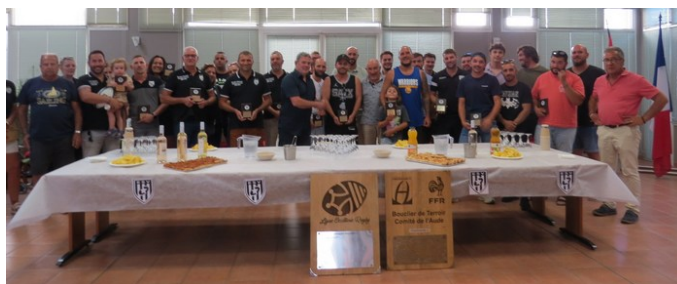
Remise bouclier ESV fin de saison