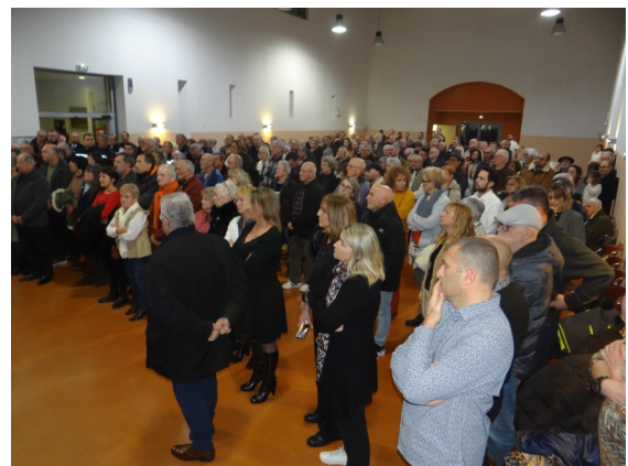
Vœux du maire