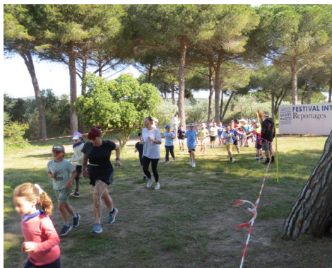
Course USEP Ecoles