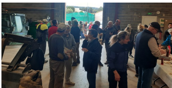
Bénévoles nettoyage Clape