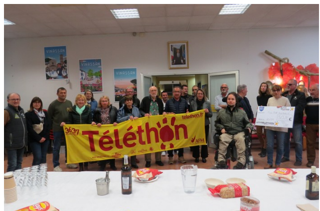
Remise chèque téléthon