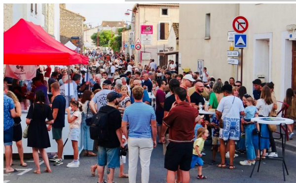
Rues en fête