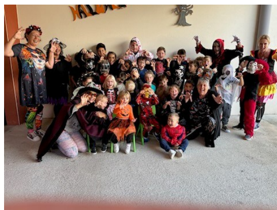
Halloween centre de loisirs