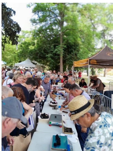
Marché de la truffe