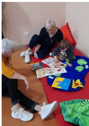
Rencontre séniors /Rpei